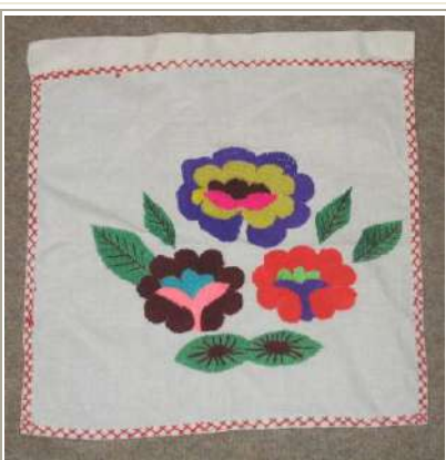
КП№: 483/Инв.№: ТН 270 Название: Салфетка

Экспонат: Оригинал Абсолютная датировка: 1980-е годы Материал: х-б ткань, х-б нити Техника: шитье, вышивка Размер: 83 * 50 см Сохраность: В сохранности Сдатчик: Э.Р.Усманова. г.Караганда.