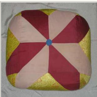
КП№: 1884/Инв№: ТН 293 Название: Подушка напольная - жер жастык.

Экспонат: Оригинал Абсолютная датировка: 1990-е годы Материал: шелк, шерсть, вата Техника: шитье Размер: 71*180 см Сохраность: в сохранности Сдатчик: Передала Абилова Б.У. г.Костанай