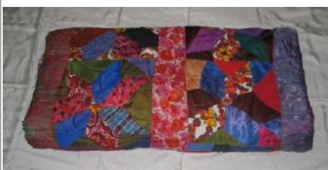
КП№: 1886/Инв№: ТН 292 Название: Одеяло ватное - корпе