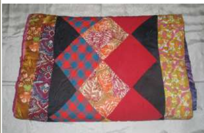
КП№: 1885/Инв№: ТН 291 Название: Одеяло ватное - корпеше.