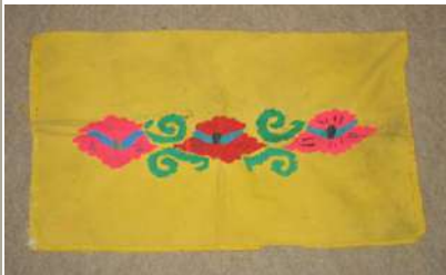
КП№: 912/Инв.№: ТН 267 Название: Вставка для наволочки

Экспонат: Оригинал Абсолютная датировка: 1980-е годы Материал: х-б ткань, шерстяные нити Техника: вышивка "гладь" Размер: 35,0*56,0 см Сохраность: в сохранности Сдатчик: Э.Р.Усманова. г.Караганда.