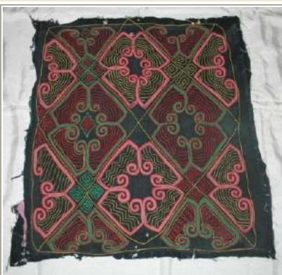
КП№: 908/Инв.№: ТН 268 Название: Салфетка

Экспонат: Оригинал Абсолютная датировка: 1980-е годы Материал: х-б ткань, шерстяные нити Техника: вышивка "гладь" Размер: 35,0*56,0 см Сохраность: в сохранности Сдатчик: Э.Р.Усманова. г.Караганда.