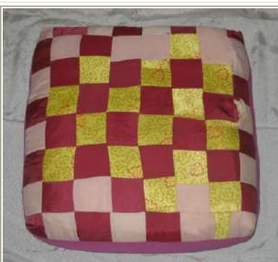
КП№: 1883/Инв№: ТН 294 Название: Подушка напольная - жер жастык.

Экспонат: Оригинал Абсолютная датировка: 1990-е годы Материал: шелк, х-б ткань, войлок Техника: ручная работа Размер: 42*42*8 см Сохраность: в сохранности Сдатчик: Передала Б.У.Абилова. г.Костанай